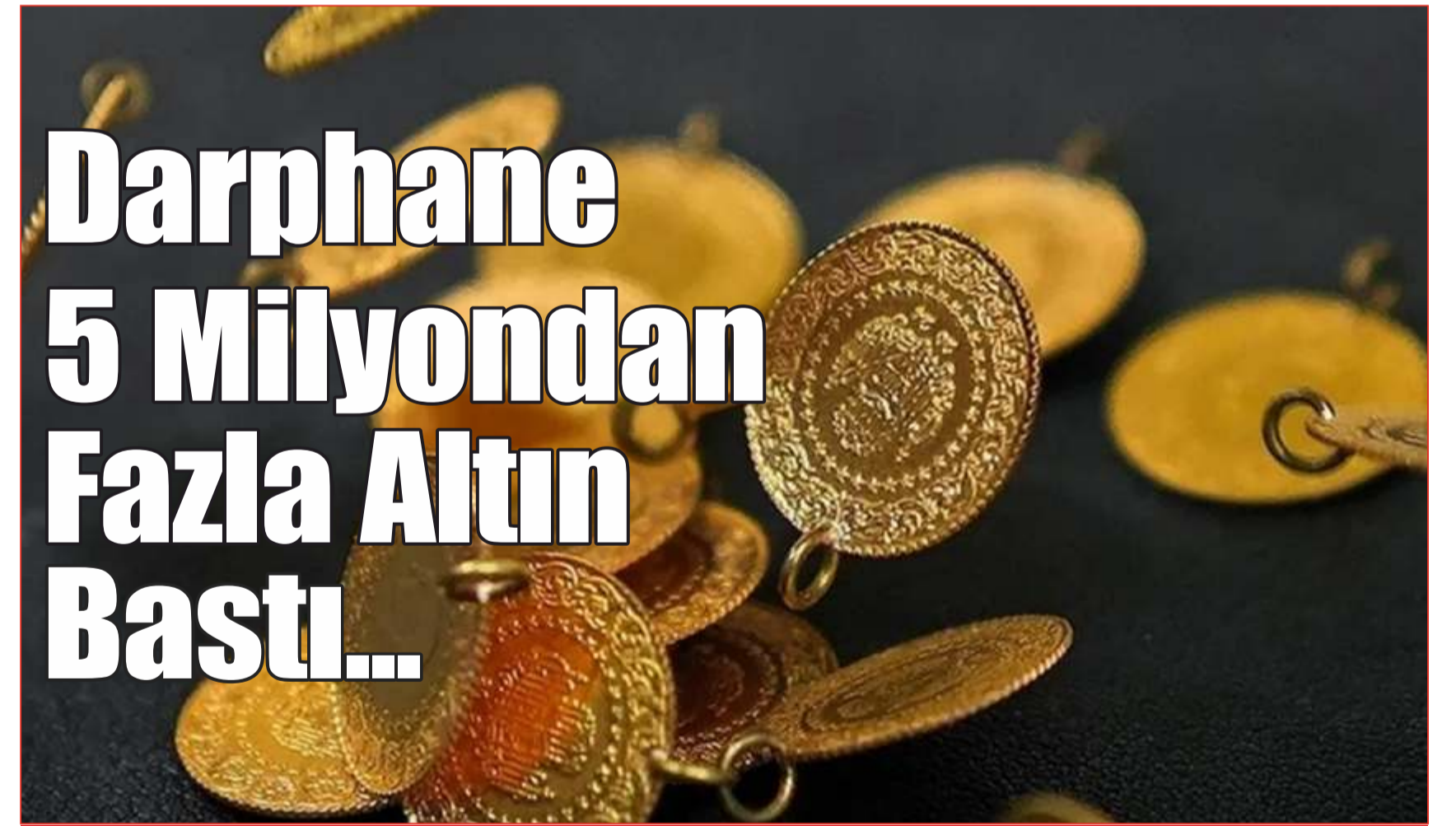
Türkiye'de yılın ilk çeyreğinde, çeşitli türlerde toplam 5 milyon 138 bin 608 altın basılırken, 2 milyon 952 bin 400 adetle çeyrek zinet altın en çok basılan altın çeşidi oldu.

Şubatta gerçekleşen 370 milyon dolar değerindeki yatırım sermayesi girişlerinde, 65 milyon dolarlık yatırım girişi ile bilgi ve iletişim, yüzde 18'lik bir pay aldı. Finans ve sigorta faaliyetleri ile